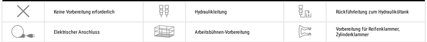
TABELLE DER SYMBOLE