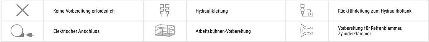
TABELLE DER SYMBOLE