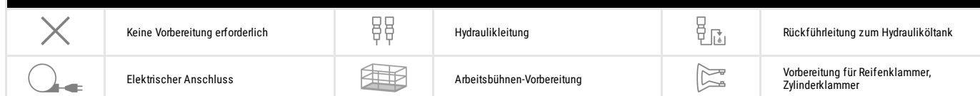
TABELLE DER SYMBOLE