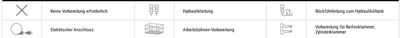
TABELLE DER SYMBOLE