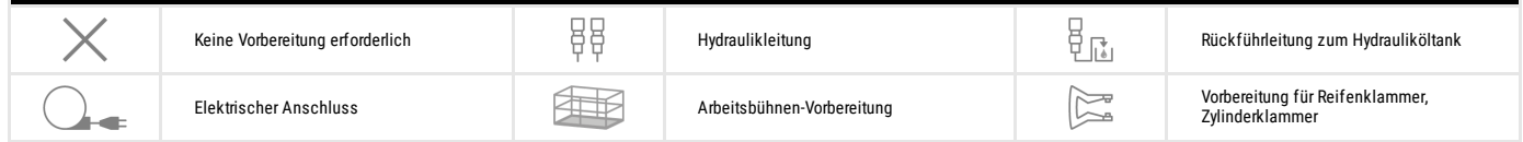
TABELLE DER SYMBOLE